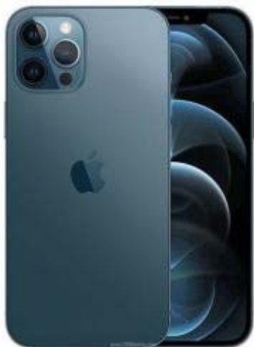
Kép az Apple iPhone 12 Pro Okostelefonról!