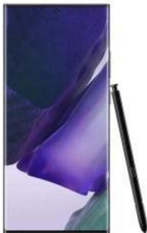
Kép az Samsung Galaxy Note20 Ultra Okostelefonról!